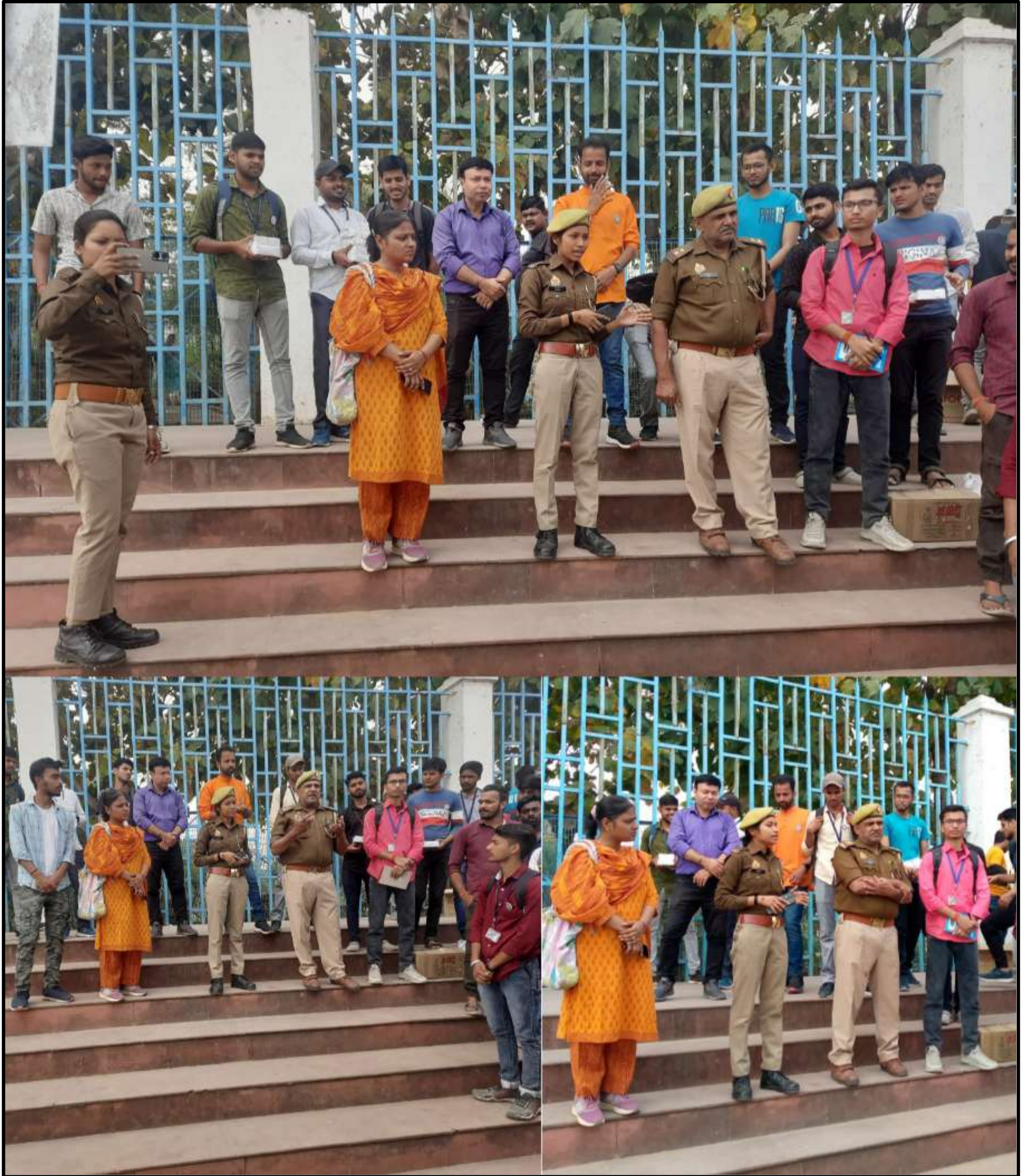
इस प्रकार कार्यक्रम अधिकारी के नेतृत्व में सात दिवसीय विशेष शिविर का चौथा दिन सफलतापूर्वक संपन्न हुआ।