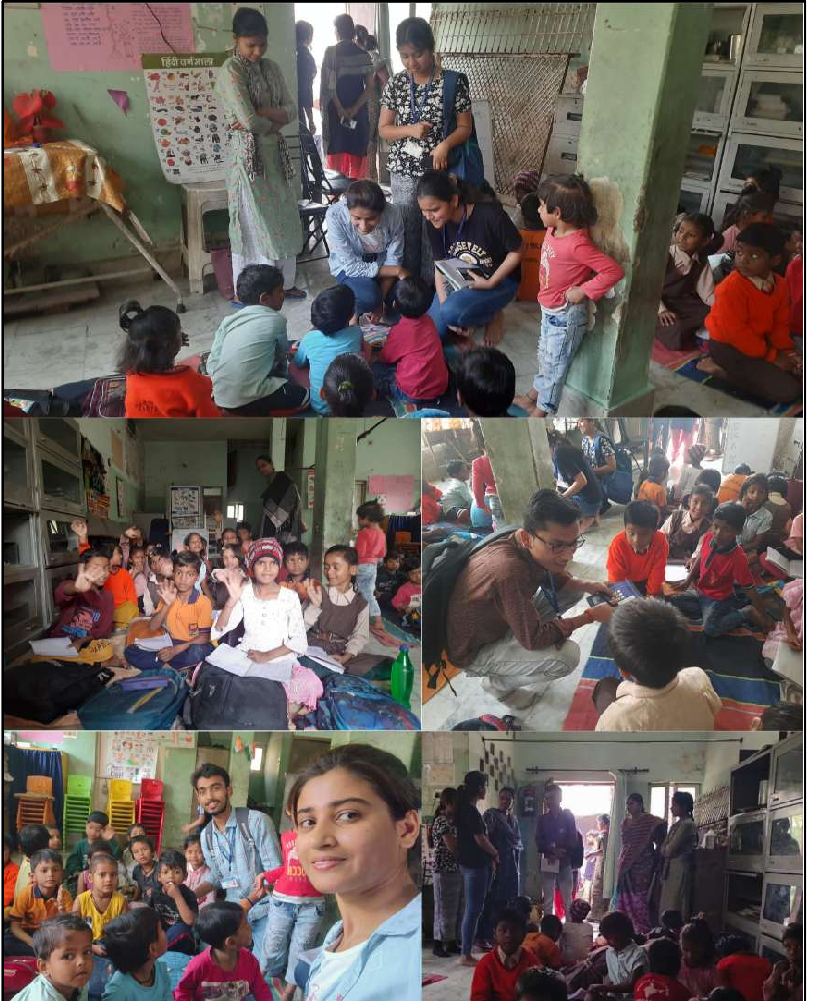
फिर स्वयं सेवकों ने कविता विमोचन, वाद-विवाद व अन्य पाठ्येतर गतिविधियां में भाग लिया।